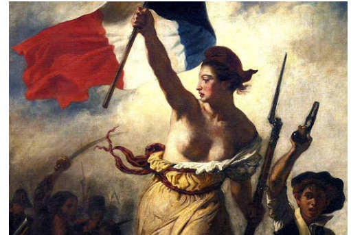
La libertad guiando al pueblo es un cuadro que simboliza las revoluciones liberales europeas.

Los legados de la Ilustración y de la Revolución francesa, cuyas ideas se expandieron a fines del siglo XVIII, fueron fundamentales en los procesos políticos que se desarrollaron en Europa y América durante el siglo XIX y en la conformación del liberalismo , doctrina política, económica y social que defiende la libertad del individuo y la limitación del poder del Estado. Estas ideas sentaron las bases para el desarrollo de los sistemas de gobierno republicanos , en los cuales los ciudadanos eligen a sus autoridades máximas, y la vida en sociedad está regulada por leyes, entre otros principios fundamentales.